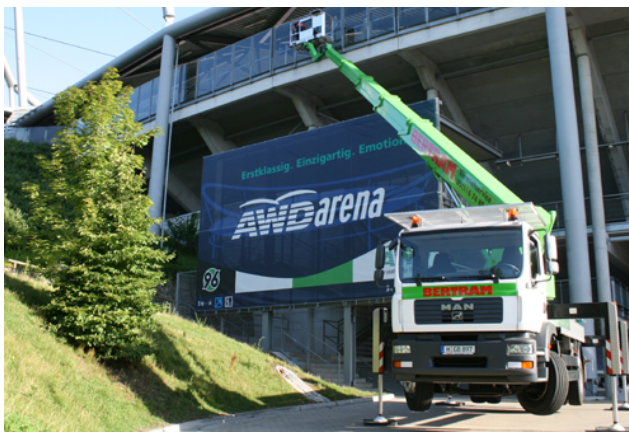
Arbeitsdiagramm WT350 L WUMAG elev jant

Interne Geräte-Nr. .... 01638 Antriebsart..... LKW-Motor Hersteller ..... WUMAG Hersteller-Typ ..... WT 350 Farbe..... Aufbau in RAL 6018 Hubsystem..... Teleskop Motor..... 206 kW / 280 PS LKW-Fahrgestell ..... MAN TGM 18.280 4x2 BB EURO4 Baujahr Trägerfahrzeug..... 2007 Baujahr Aufbau..... 2008 Inbetriebnahme..... 05/2008 Gebrauchtgerät: inkl. UVV-Abnahme gemäß BGG 945